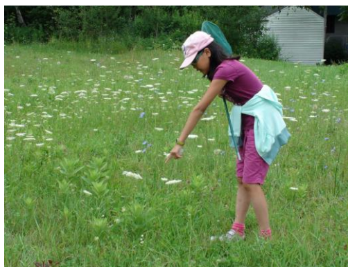
Chasse aux insectes