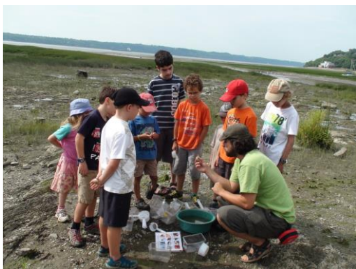
Cueillette et identification d'invertébrés