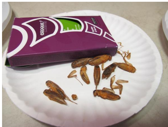
Dégustation d'invertébrés (ici, des grillons)